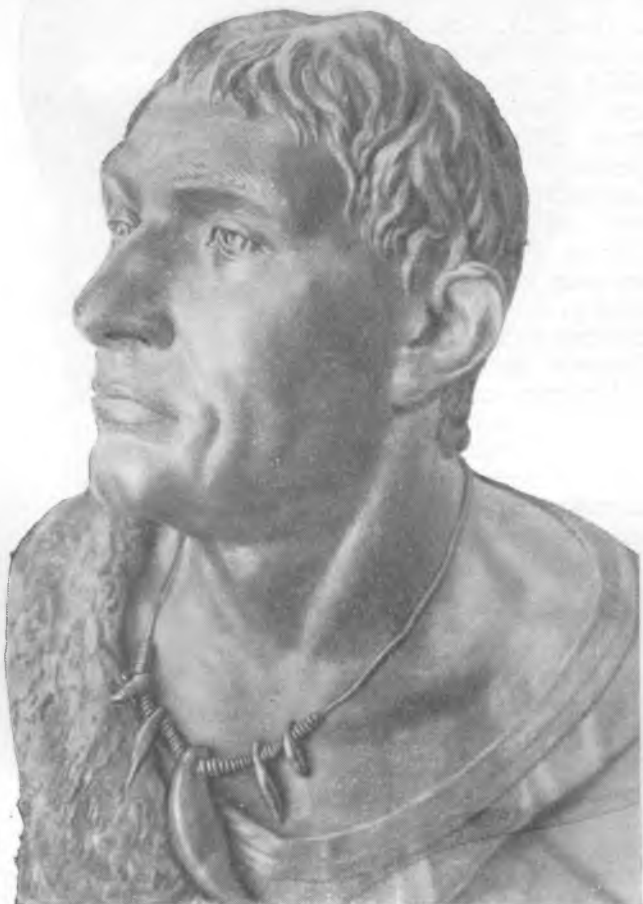
Рис. 3. Мужчина балановской (фатьяновской) культуры восточно-средиземноморского типа. Реконструкция М. М. Герасимова по черепу из погребений в Балановском могильнике (ЧАССР)

Из Балановского могильника был получен благодаря раскопкам Бадера и Акимовой значительный костный материал хорошей сохранности. В результате изучения черепов из Балановского могильника М. С. Акимова пришла к выводу, что длинноголовый европеоидный антропологический тип относительно узко- и высоколицый из Балановского