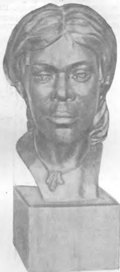
Рис. 2. Женщина балахнинской неолитической культуры с некоторыми „малайскими“ или „негроидными“ чертами в типе лица. Реконструкция М. М. Герасимова по черепу из погребений в Гавриловской стоянке (Горьковская область)

известного населения европеоидного типа с территории Восточной Европы 4 позднейших эпох. Черепа лапоноидного типа известны в погребениях неолитической стоянки возле Каравайхи Вологодской области; близкие формы отмечены также в неолитической стоянке Южного Оленьего острова на Онежском озере, в более поздней Языковской стоянке Калининской области; наконец, к значительно более позднему времени — концу II — началу I тысячелетия — относятся черепа из раскопок в Среднем Поволжье (рис. 1). Так, к лапоноидному типу относятся: один череп из раскопок Высоцкого 1870 г. близ с. Ново-Мордово б. Спасского уезда Казанской губ. и два черепа из раскопок Штукенберга 1901 г. из урочища Пустая Морквашка близ с. Моркваши б. Свияжского уезда. Г. Ф. Дебеч относит эти погребения к волжско-камскому энеолиту и считает их, по всей вероятности, более или менее синхроничными Карташихинской стоянке. Но в настоящее время есть основания датировать эти погребения более поздним временем. Так, погребения у Ново-Мордово следует относить к концу II тысячелетия, а у с. Моркваши — к началу I тысячелетия до н. э. На основании короткоголовости в сочетании с малыми абсолютными размерами их Г. Ф. Дебеч считает возможным отнести эти черепа к лапоноидным формам 5 . Широкое распространение лапоноидных форм в неолите на территории Восточной Европы дает основание рассматривать черепа людей лапоноидного типа из Среднего Поволжья как потомков местного неолитического населения.