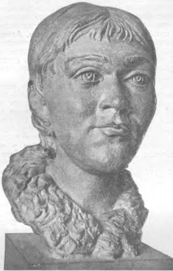
Рис. 1. Женщина культуры ямочно-гребенчатого неолита лапоноидного типа. Реконструкция М. М. Герасимова по черепу из погребений в Каравайхе (Вологодская область)

Антропологическое изучение современного чувашского населения должно быть продолжено; в особенности необходимо поставить работы в юго-восточных районах Чувашской АССР, в местностях, в прошлом относившихся к территории б. Булгарского государства. Дальнейшие исследования могут внести уточнения в намеченную антропологическую характеристику чувашского народа.