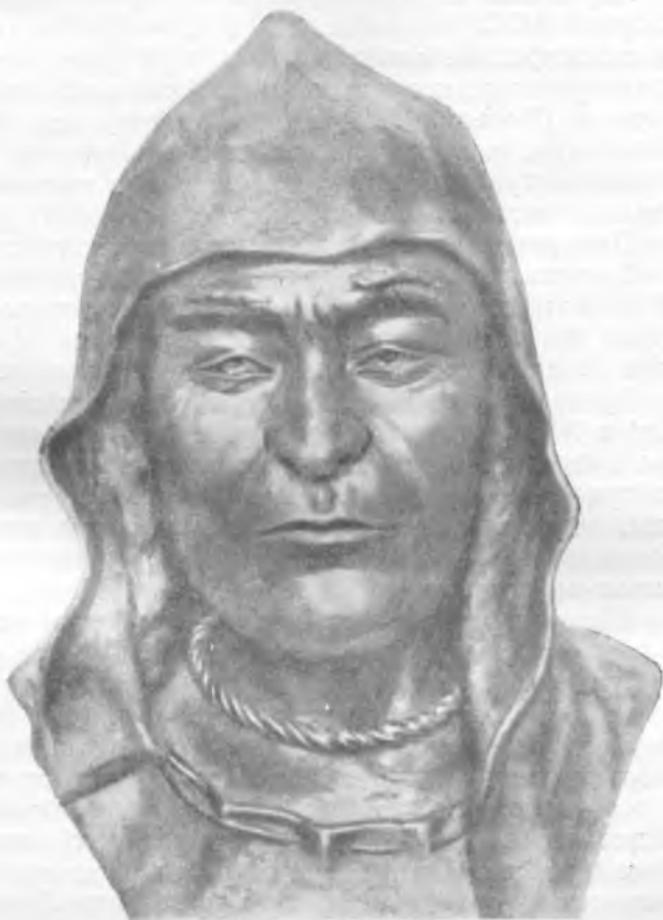
Рис. 5. Мужчина ананьинской культуры монголоидного типа. Реконструкция М. М. Герасимова по черепу из Луговского могильника (ТАССР)

Череп срубно-хвалынской культуры из погребений в Полянках и Маклашеевке III 17 с левобережья Волги у Камского устья характеризуются длинноголовым, относительно широколицым европеоидным типом с некоторой примесью лапоноидных черт на отдельных черепках (Дебец, Трофимова) 18 . Позднее на этой же территории в эпоху появления железа (Маклашеевка II) население состоит из двух отчетливо различающихся антропологических типов: длинноголового европеоидного, встречающегося среди населения племен срубно-хвалынской культуры, и более короткоголового с нерезко выраженными монголоидными признаками, возможно, связанного с древним местным неолитическим населением 19 .