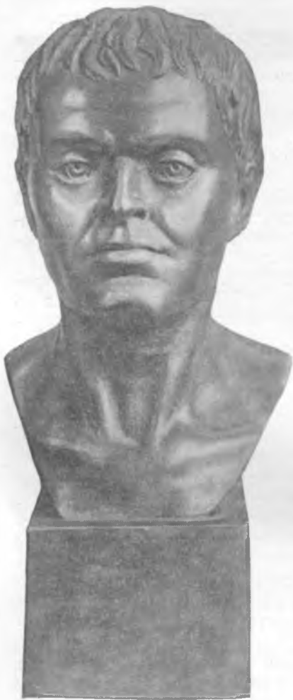
Рис. 4. Мужчина абашевской культуры европеоидного широколицего типа. Реконструкция М. М. Герасимова по черепу из Алгашинского могильника (ЧАССР)

быть прослежена также связь населения племен абашевской культуры с неолитическим населением балахнинской культуры. Я имею в виду сходство строения женских черепов из Катергино-Бишево и Гаврилов-